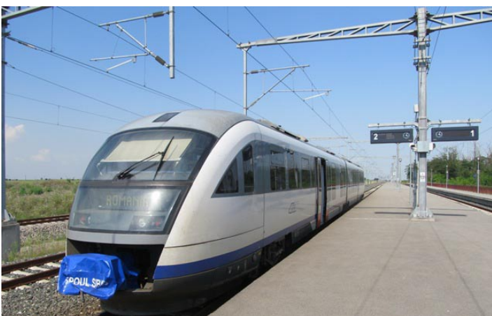
Влака за Видин на гара Голенци.