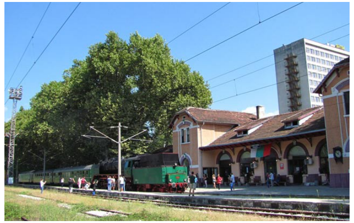
Атракцион на Габрово.