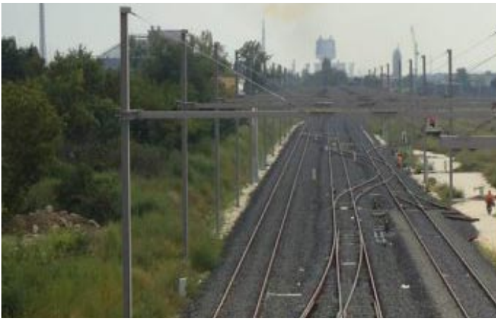
Ремонта на гара Димитровград – гърловина страна Нова Надежда