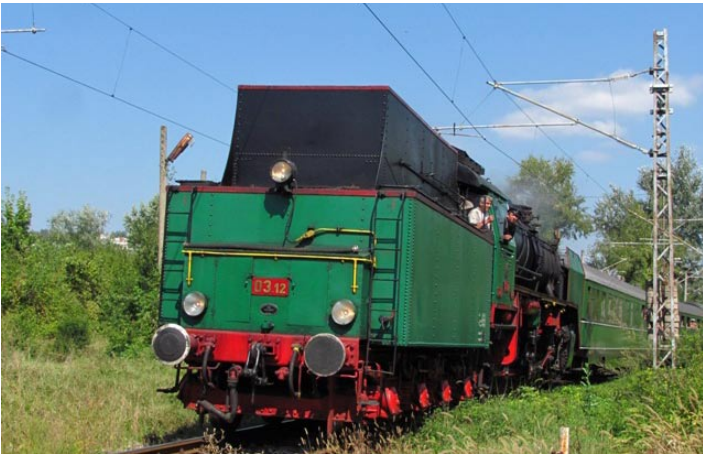
Атракционен влак пристига в Габрово.