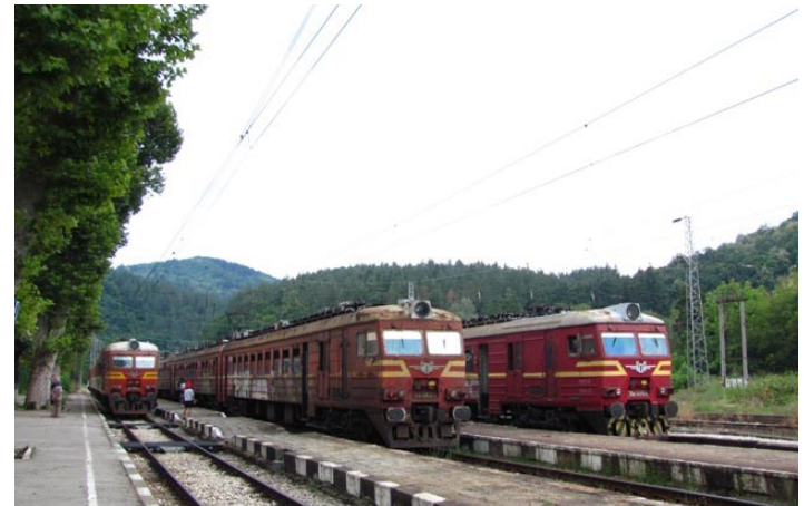
Тройна среща на ЕМВ гара Царева ливада.